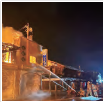
輪島市朝市火災現場での活動