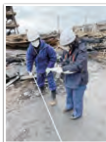
消防庁長官調査の模様

また、1月10日には、輪島市大規模火災について消防法第35条の3の2に基づく消防庁長官調査を実施するため、消防研究センター職員3名を輪島市へ派遣しました。