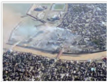
輪島市河井町火災現場周辺

さらに、石川県、富山県及び新潟県の 3 県で 17 件の火災が発生し、特に石川県輪島市河井町では、区域内の建物が約 240 棟焼損し、焼失面積は 49,000 平方メートルに及ぶ大規模火災が発生しました。