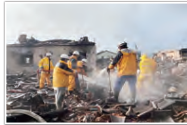
輪島市消防団による消火活動の様子

中、地域に密着した消防団が、地域防災力の中核として、非常に大きな役割を果たし、地域住民同士の助け合いの中核を担う消防団の役割の重要性が再認識されました。