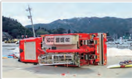
地震により横転した消防車両

また、2月3日から3月4日まで、福井県及び富山県からの県外応援隊が地元消防本部からの要請を受け、業務支援を行いました。