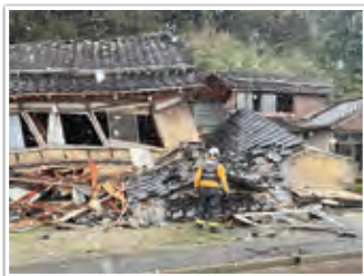
珠洲市正院町家屋倒壊現場

※内訳3県以外にも被害を受けた府県があるため、内訳3県の合計は全体の合計とは一致しない。