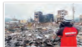
消防庁職員による 現地リエゾンの模様