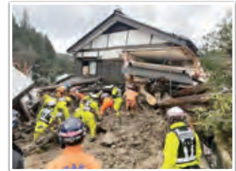
輪島市市ノ瀬町における 緊急消防援助隊の活動