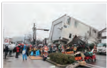
輪島市河井町建物倒壊現場