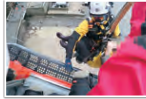
富山県防災航空隊による活動

これらの懸命な活動により3月15日までに救助者数は295人、救急搬送者数は1,577人（地元消防本部等と協力し救出したものを含む）となっている。