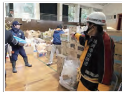
珠洲市消防団による避難所運営支援の様子