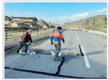
輪島市消防団による亀裂の入った道路補修の様子 （輪島市消防団門前分団員提供）