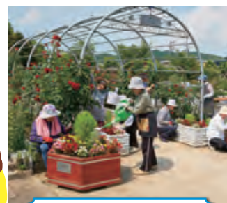
フラワープランター