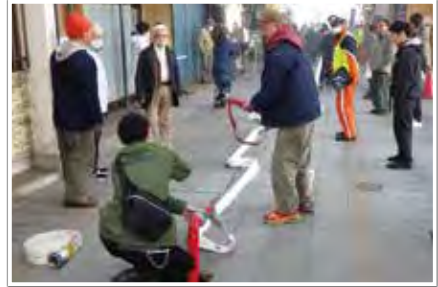
地域住民への防火防災訓練指導 (東近江行政組合消防本部)

ここ数年、新型コロナウイルス感染症の感染拡大の影響により、対面による訓練指導の機会が減少し、地域住民の防災行動力の低下が懸念されました。しかし、そうした中でもリモートによる応急手当講習やICTを活用した防災学習等、新たな手法による防災に関する知識や技術の維持向上の取り組みが進展してきたところです。今後、これらの手法と対面による訓練指導を併用して実施していくことにより、地域住民の防災行動力を一層高めていくことができると考えられます。