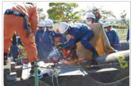
消防団との連携訓練 (吉川松伏消防組合消防本部)

さらに、地域が一体となって防災対策を推進するために、町会・自治会と事業所が災害時に助け合うことを目的とした応援協定の締結等が効果的であり、消防本部もその仲介役としての役割を担えると考えます。