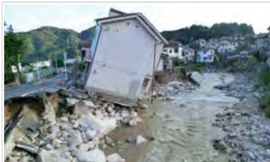
土石流で被災した家屋（安佐北区口田南）

町内会・自治会へ回覧板を回し、地域で防災活動に関心のある方、さらに会社で防災に関する業務である方や防災部署に所属している方を募集し、「防災委員」に任命しました。