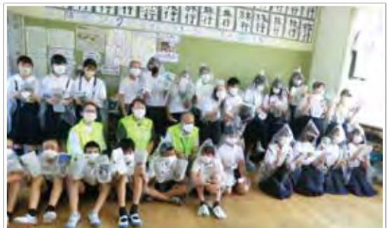
落合小学校防災教育（防災工作）

落合学区の防災活動、特に避難所運営や災害時の要支援者支援体制の充実を図るため、町内会自治会連合会長と協議して、自主防災会連合会が「安否確認システム」を学区全体に導入し、学区住民の人命の確保と福祉の充実を中心となって進める。