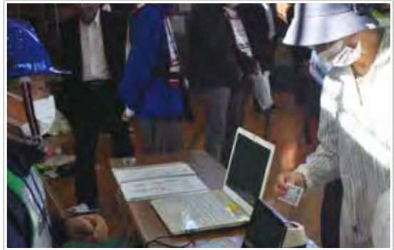
令和4年度の防災訓練で運用した安否確認システム