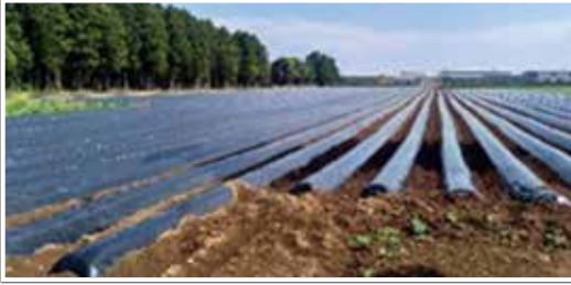
営農再開されたさつまいもの大規模農地（楢葉町）