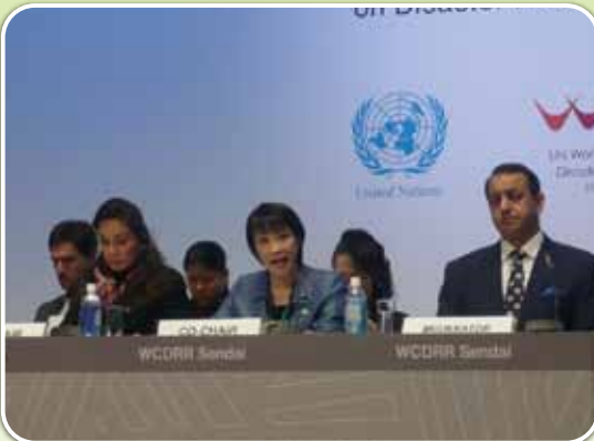
「防災における女性のリーダーシップ発揮」セッションで挨拶する高市早苗総務大臣