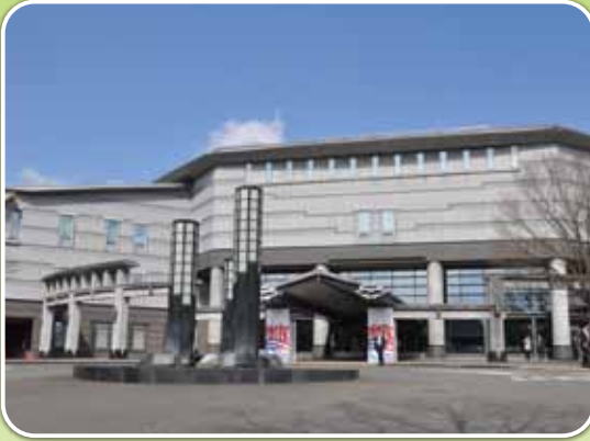
メイン会場となった仙台国際センター