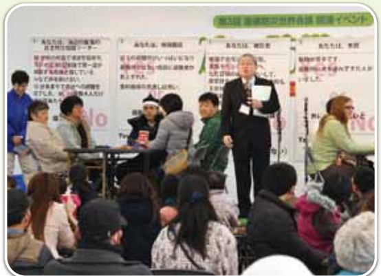
防災ゲーム・クロスロード