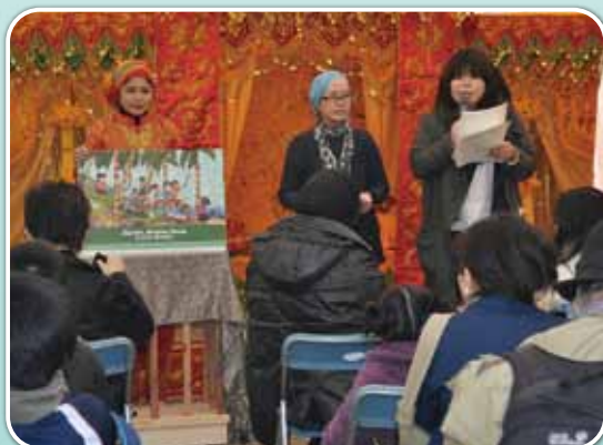
津波伝承紙芝居（インドネシア・シムル島より）