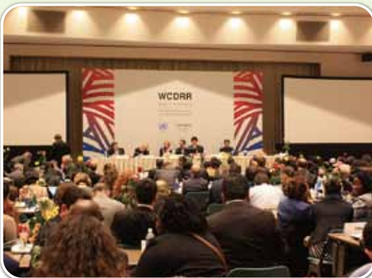
187か国の国連加盟国代表による意見交換