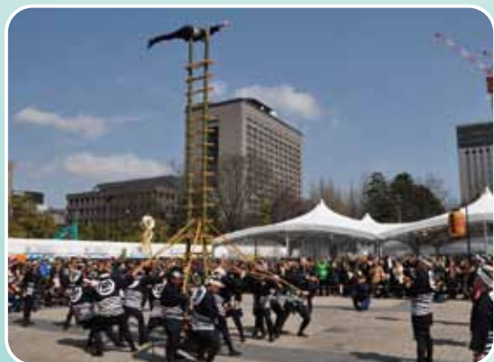
仙台市7消防団による伝統はし子乗り演技