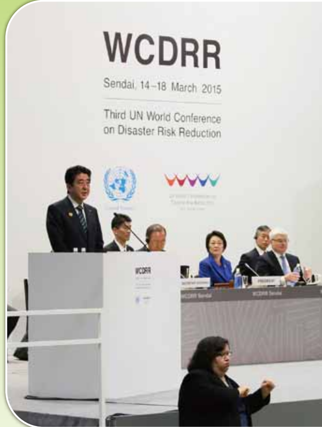
天皇后両陛下ご臨席のもと開会式で挨拶を述べる安倍晋三内閣総理大臣