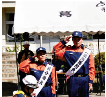
実はもう一つおまけに防犯少年隊も兼ねており、3つのクラブで多彩な活動を体験しています。平成22年にはモデル少年消防クラブの称号をいただき、新調いただいた鮮やかなオレンジ色の活動服で、子供達は意気揚々と明るく活動をしています。

近年、町の防災計画が見直され、行政と地域の自治会との連携による全町民参加型の総合防災訓練への参加も実現し、消防団の皆さんにも引けを取らない威風堂々たる活動を展開しています。